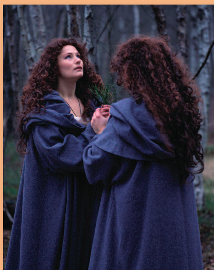
Legenden om juleroserne